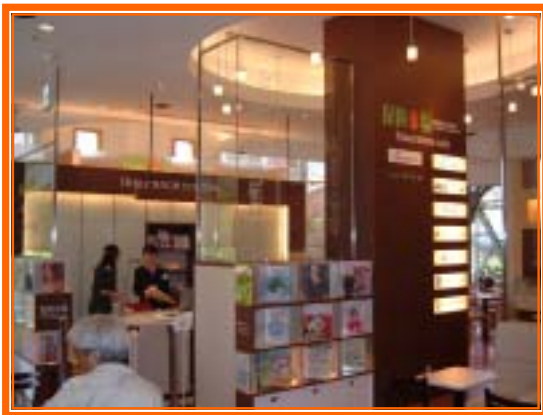
カフェ・ド・クリエ神戸ハーバーランド店

（ ）財団法人店舗システム協会が「消費者の視点から特に優れたサービスや店舗」を顕彰するもので、今年は45プロジェクトが表彰されました。