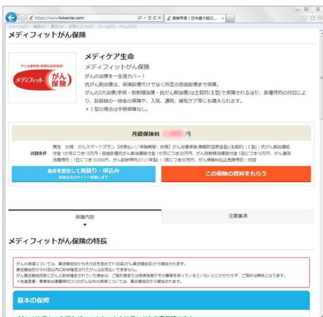
【スマートフォン版】