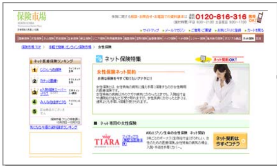
「保険市場」の「ネット契約」画面イメージ