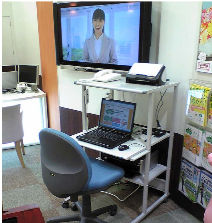
＜スキャンで簡単店頭見積システムの写真画像＞

アドリック損保では、新たな自動車保険販売スキームにより今後も一層サービスの向上につとめ、お客様に安心・満足いただける自動車保険会社を目指してまいります。